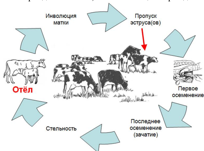
Рис. 1. Схема репродуктивного цикла

После отёла в начавшемся новом репродуктивном цикле можно выделить период инволюции репродуктивных органов, период возможного сознательного пропуска эструса(-ов), период осеменения и период стельности, заканчивающийся рождением телёнка (рис. 1).